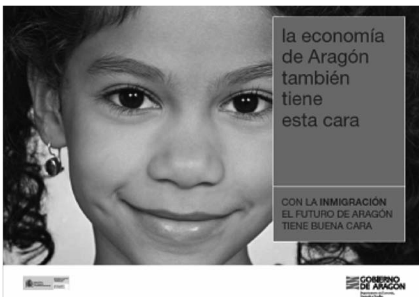
Campaña 2007 "Con la inmigración el futuro de Aragón tiene buena cara"

Con el eslogan "Los nuevos aragoneses", el gobierno de Aragón realizó una campaña que nos lleva a pensar que se pretende diferenciar entre unos aragoneses de primera y otros de segunda o, incluso, que hay unos autóctonos "viejos" y otros "nuevos", en definitiva, que hay un antes y un después