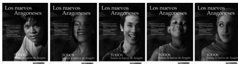
Campaña 2007 "los nuevos aragoneses. Todos somos la fuerza de Aragón"

Con el eslogan "Los nuevos aragoneses", el gobierno de Aragón realizó una campaña que nos lleva a pensar que se pretende diferenciar entre unos aragoneses de primera y otros de segunda o, incluso, que hay unos autóctonos "viejos" y otros "nuevos", en definitiva, que hay un antes y un después