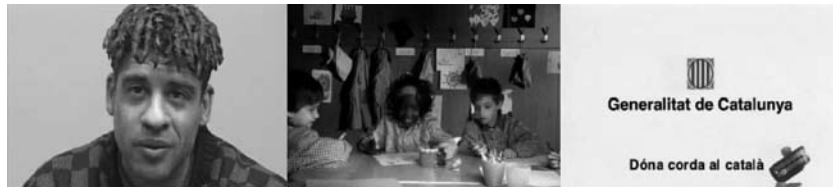
Campaña "dale corda al català"

La comunidad valenciana no ha realizado ninguna campaña ad hoc de integración y de sensibilización, sino que directamente en sus anuncios se incluye al nuevo ciudadano inmigrante. Esto sorprende, dado que la Comunidad de Valencia es una de las tres primeras que recibe más inmigración de España