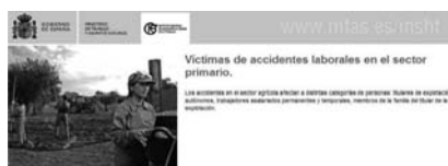
Campaña de sensibilización en el ámbito estatal sobre riesgos laborales del Ministerio de Trabajo e Inmigración

incluirán y especificarán las indicaciones necesarias sobre el objetivo de cada campaña. En los últimos dos años, fechas desde que se realizan estos Planes, el tema de inmigración ha sido una de las prioridades del Gobierno. En el 2006 la única campaña en materia de inmigración fue la que se instrumentó para evitar la inmigración ilegal de los Senegaleses en España 12 (Informe de Publicidad y Comunicación Institucional, 2006) en la que se invirtió 503.089 euros. En el 2007, la Secretaría de Estado de Inmigración y Emigración del Ministerio de Trabajo y Asuntos Sociales invirtió dos millones de euros en la campaña de publicidad sobre inmigración (Informe de Publicidad y Comunicación Institucional, 2007) 13 , y en el 2008 se lanzó la campaña de sensibilización en el ámbito estatal sobre riesgos laborales del Ministerio de Trabajo e Inmigración (coste de 3,5 millones de euros) 14 además del programa de retorno de inmigrantes del mismo ministerio (3.2 millones de euros), véanse a continuación.