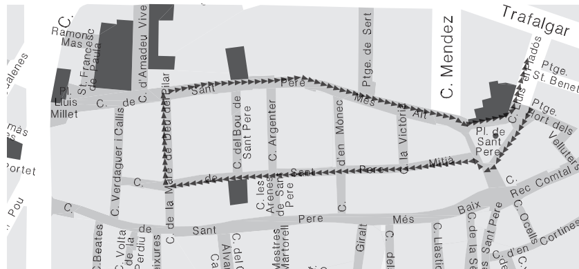
El trazo marca el recorrido de la procesión de la ashura en el periodo 2004-2007. La marcha tiene inicio en la mezquita del Centro Islámico Al Qaim (C. Sant Pere Mitjà número 21) y finaliza en el mismo lugar, pasando por las calles Mare de Déu del Pilar, Sant Pere Més Alt, Plaça de Sant Pere y, lógicamente, Sant Pere Mitjà. Se puede observar la estrechez de las calles. En el plano se distinguen dos tipos de vías: las de tráfico restringido (fondo gris) y las de tráfico vehicular permitido (fondo blanco).

Desde el año 2004 y hasta el 2007, la Asociación Cultural al Qaim organizó el ritual de luto de Husein en torno a su sede barcelonesa, habiendo realizado la comunicación previa del Ayuntamiento, que dio consentimiento para ocupar la calle entre las 14 h y las 17 h. El Ayuntamiento de Barcelona dio los permisos de ocupación del espacio público el año 2007 con una condición: que no hubiera un solo rastro de sangre en los cuerpos de los participantes. Es pertinente indicar que el ya mencionado golpeo repetitivo de los cuerpos de los asistentes ( matam ) culmina ocasionalmente con la aparición de sangre, que en el contexto de este ritual los chiítas asocian simbólicamente al dolor infringido a Husein. Volvamos al caso barcelonés. La comitiva salía del oratorio, situado en la calle Sant Pere Mitjà, poco después de las 14 h. Sostenían una reproducción de la tumba de Husein y diferentes pancartas de tela conmemorativas para la ocasión, y se desplazaban, en dirección a Via Laietana, hasta la calle Mare de Déu del Pilar, por donde accedían a Sant Pere Més Alt. La procesión discurría por esta calle hasta llegar a la plaza de Sant Pere, lugar en el que se hacían los parlamentos y la oración y desde donde volvían a la mezquita para comer en comunión.