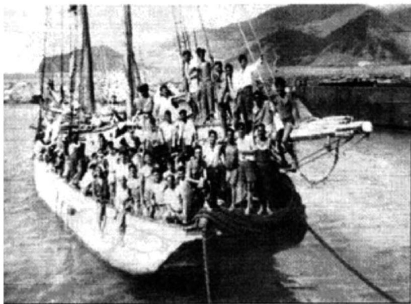
Imagen de los tripulantes de "La Elvira" a su llegada a Puerto de Garopano, Venezuela, en Mayo 1949

En todas las campañas de publicidad institucional se tiende a la interculturalidad buscando la aceptación del "otro" y su integración