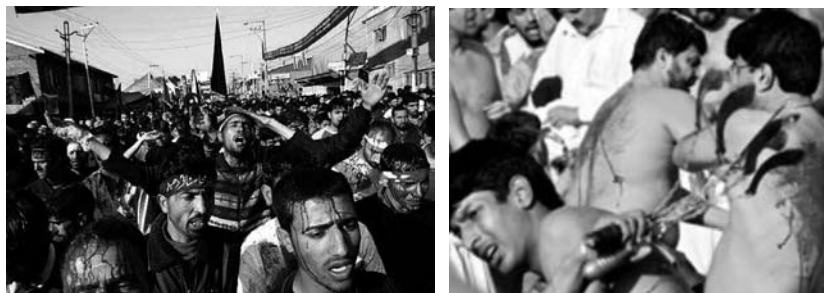
Derecha, una imagen de la ashura que se puede encontrar en la edición digital del diario gratuito 20 minutos . La imagen de la izquierda corresponde al artículo del periódico ABC publicado el 29 de enero del año 2007 con el título de "La fiesta de la Ashura".

La ashura es probablemente uno de los rituales más mediáticos a nivel mundial. En España no es extraño que las portadas de los periódicos ofrezcan imágenes sanguinarias el día después del ritual; suele tratarse de primeros o medios planos de hombres iraquíes con incisiones en la cabeza y con la cara cubierta de sangre